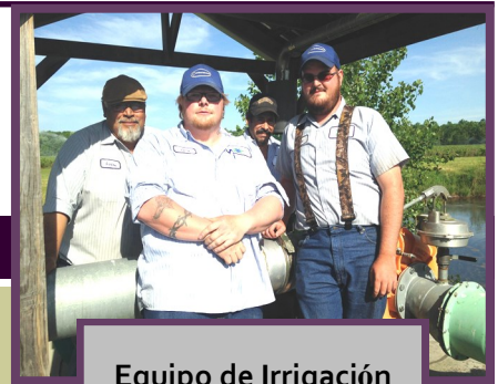
Equipo de Irrigación