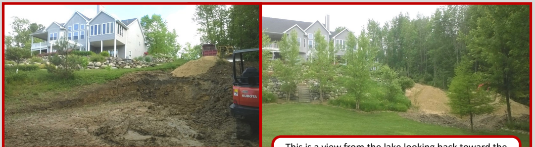
This is the new septic drained area before 42" of sand were hauled in.