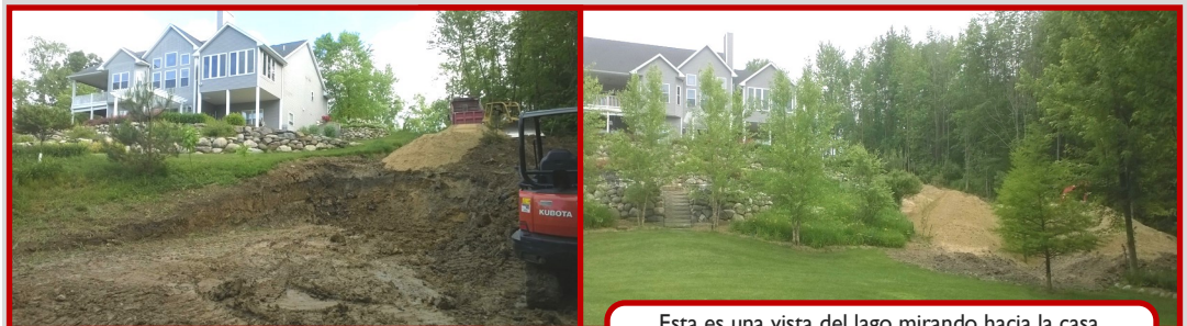
Esta es la nueva zona desagüe séptico antes de 42" de arena fueron transportados.