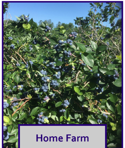
Home Farm Bluetta