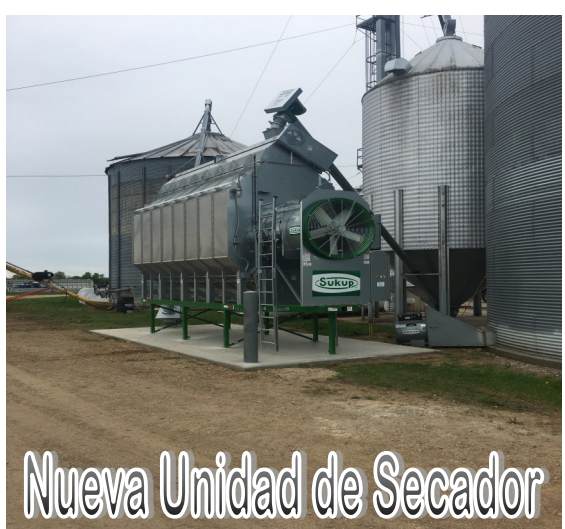
Nueva Unidad de Secador

Esperamos comenzar tentativamente la Cosecha de Arándanos 2019, la primera semana de julio. Esto es aproximadamente una semana más tarde de lo que normalmente empezamos.