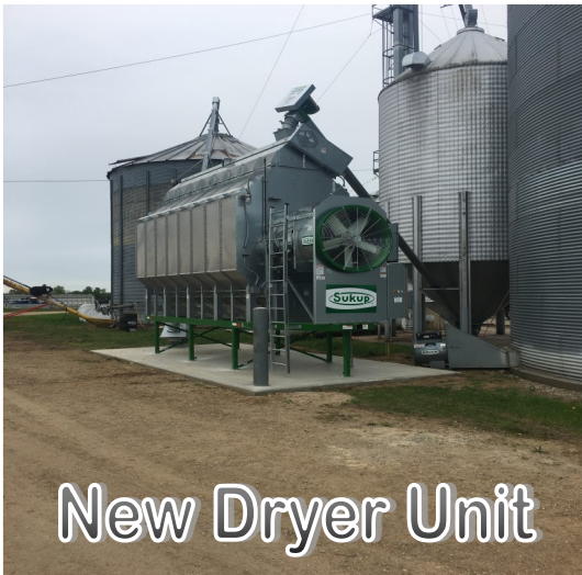
New Dryer Unit

WE ALL KNOW YOU CAN DO IT! WISHING YOU THE BEST FROM ALL OF US